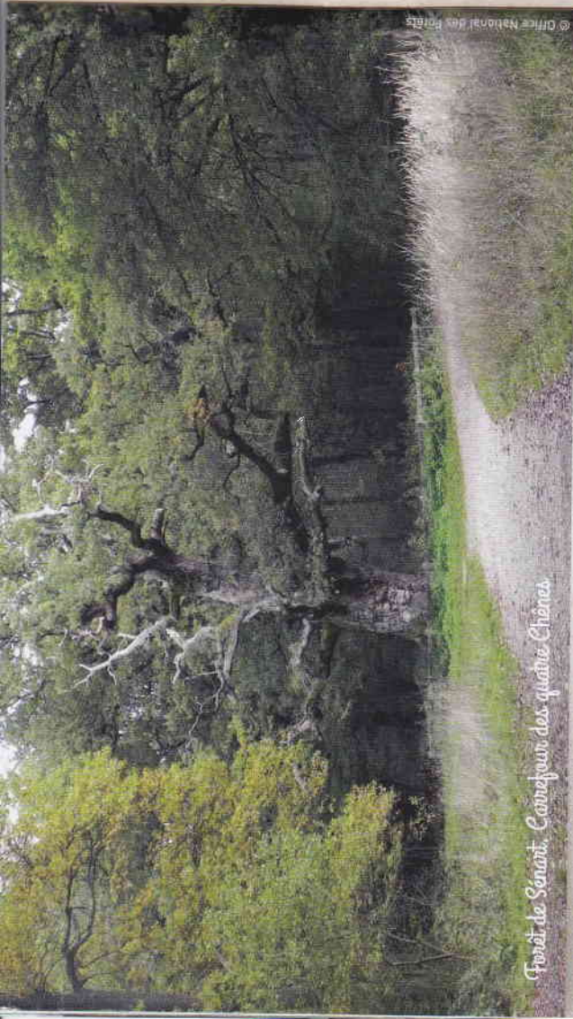
Forêt de Sénart. Carrefour des quatre Chênes.