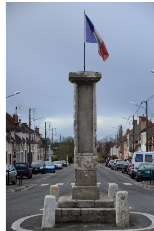
Randonnée Permanente de la Confrérie des Brevets de France