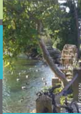
© J. GERMAIN © C. Constanty/GoVe/SMAEWW